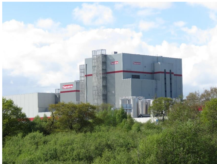
Usine Synutra-Sodiaal à Carhaix