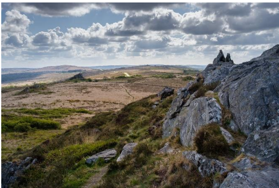
Paysage des Monts d'Arrée

Le territoire compte une grande variété d'espaces naturels, imbriqués avec les terres agricoles, dans une mosaïque de milieux riches et favorables à la biodiversité et aux écosystèmes de Bretagne. L'adaptabilité du territoire face aux changements climatiques passe par le maintien d'une biodiversité pérenne.