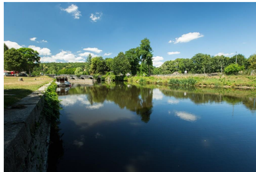
Canal de Nantes à Brest