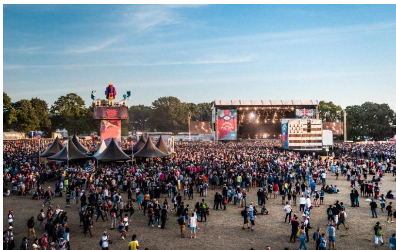
Festival des Vieilles Charrues, Carhaix-Plouguer