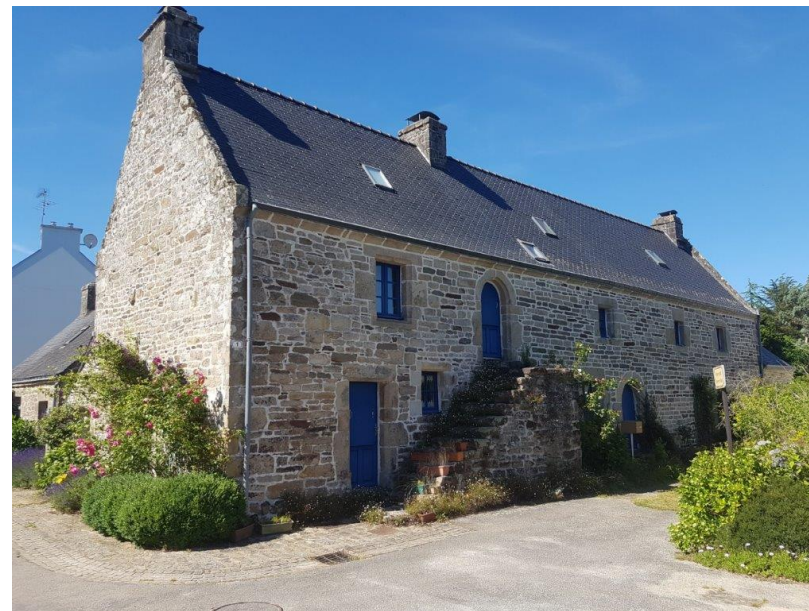
Logis ancien à Le Saint