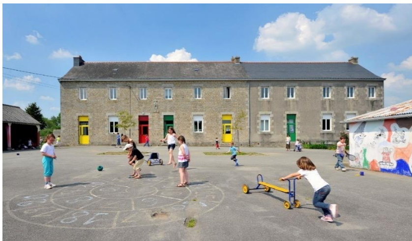
Ecole de Meslan